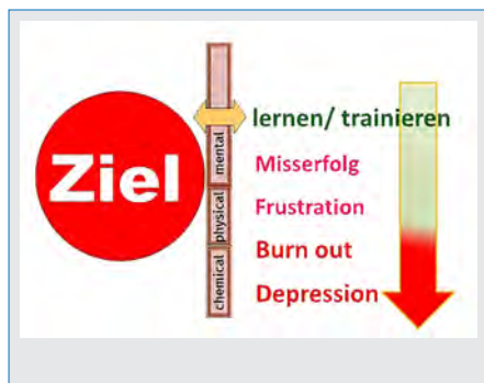
Abb. 1: Vor allem mentale Stressoren verwehren den Weg zum Ziel.

Aus kinesiologischer Sicht ist dies alles gut erklärbar, nur das Verständnis hierfür fehlt oft bei Schulen und Sportvereinen. Wir haben aber damit begonnen, vor allem in