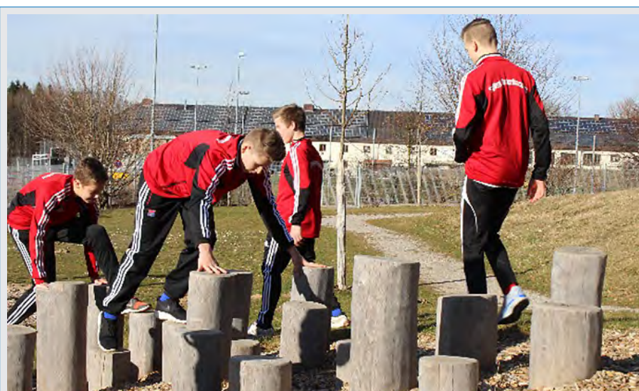
Abb. 3: Körperliche Bewegung kann die Resilienz erhöhen.

Institut & Campus für sportkinesiologische Trainingsmethoden Bad Tölz info@kinsporth.de