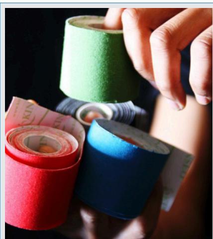
Abb. 1: In der Kinesiologie werden verschiedene Farben zum Taping benutzt.

Durch die Elastizität des Tapes wird die Haut bei jeder Bewegung leicht angehoben und